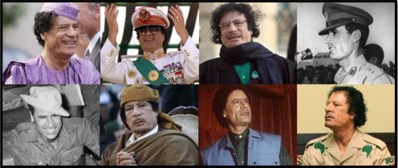
“La historia de Muammar Gaddafi” (BBC: In pictures)