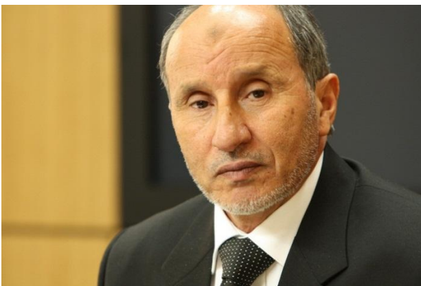
Ex Ministro de Justicia Mustafa Abdul Jalil, actual líder del Consejo Nacional de Transición.

Con el propósito de dar legitimidad a su lucha y “una cara política a la rebelión”, las fuerzas rebeldes se aglomeran a través del Consejo Nacional de Transición, organización formada por estos grupos el 27 de febrero de 2011 47 . Su estructura estaba destinada al control político y militar de los territorios bajo el dominio de las fuerzas rebeldes así como sus zonas aledañas. Se encuentra actualmente presidido por Mustafa Abdul Jalil, político libio y ex funcionario en el cargo de Ministro de Justicia dentro en la administración del presidente Muammar Gaddafi desde el año 2007 hasta el año 2011 48 .