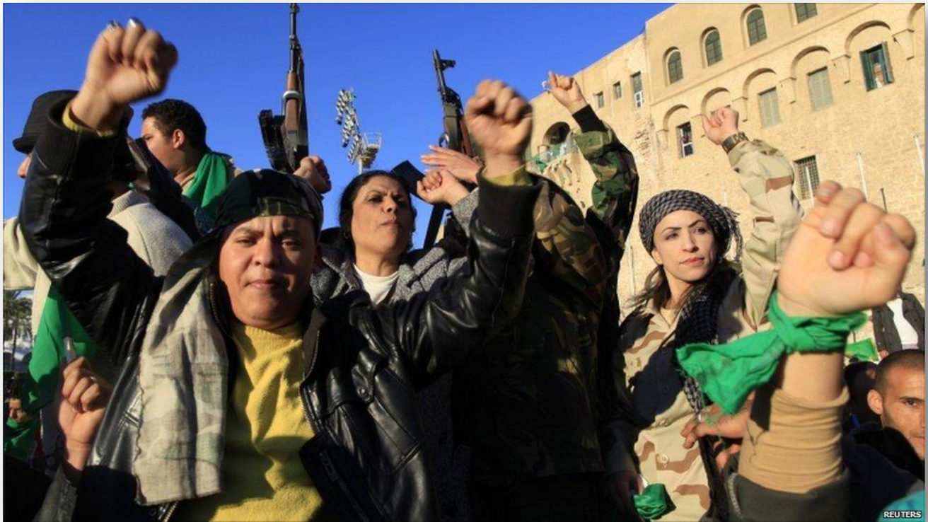
“Concentración de Rebeldes en Trípoli” (BBC: In pictures: Conflict in Libya)

El Consejo de Seguridad emite la resolución 1973(2011) donde autoriza la zona de exclusión aérea y “todas las medidas necesarias” para proteger a los civiles libios 42 , asimismo Gaddafi promete en Trípoli no rendirse y desafía públicamente a las potencias internacionales 43 . Las protestas se intensifican y aún no se manejan cifras oficiales sobre la cantidad de fallecidos, en este escenario los rebeldes consiguen nuevamente retomar Ajdabiya y continúan haciendo avances en otras partes del territorio. El 29 de marzo los líderes de EEUU, Europa y los países árabes se reúnen en Londres para discutir sus papeles en Libia, y