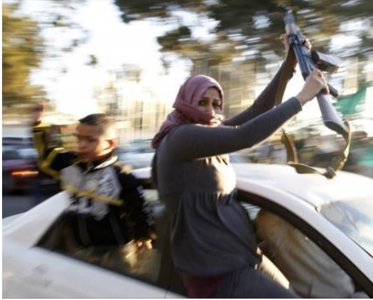
“Disparos al aire como señal de apoyo al Presidente Gaddafi”

Entre el 21 y 22 de febrero diversos líderes mundiales y diplomáticos libios hacen declaraciones en contra del gobierno de Gaddafi 26 , ello catalizado por la forma violenta e indiscriminada de sofocar las protestas 27 . Posteriormente Gaddafi hace declaraciones públicas asegurando mantenerse en el poder y culpando a las potencias occidentales y Al Qaeda de gran parte de los disturbios 28 . Los conflictos aumentaron y para el 26 de febrero, el Consejo de Seguridad por unanimidad decide imponer sanciones contra el Presidente Gaddafi en la resolución 1970 29 refiriendo asimismo la situación de Libia a la Corte Penal Internacional 30 . Un día más tarde, los rebeldes ya habían asignado al ex Ministro de Justicia Mustafa Abd el-Jalil como Ministro Interino de su recién formado Consejo Nacional de Transición 31 . Para comienzos de marzo los rebeldes comienzan a exigir la intervención