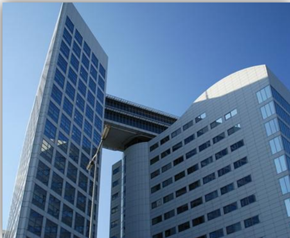
“Edificio sede de la Corte Penal Internacional, La Haya, Países Bajos.”

El consenso alcanzado en las definiciones de genocidio, crímenes de lesa humanidad y crímenes de guerra dieron lugar a la necesidad de crear un cuerpo permanente de justicia basado en estos principios 1 .