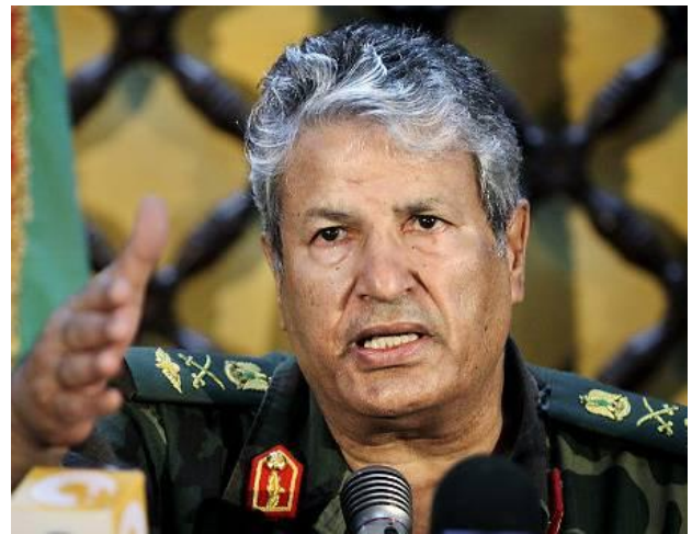
Ex Ministro de Asuntos Internos Abdul Fatah Younis, y posteriormente líder del ejército de las fuerzas rebeldes.

Su renuncia se hace explícita el 21 de febrero de 2011 por lo que él mismo describió como un “excesivo uso de la fuerza militar en contra de protestantes desarmados” 50 .