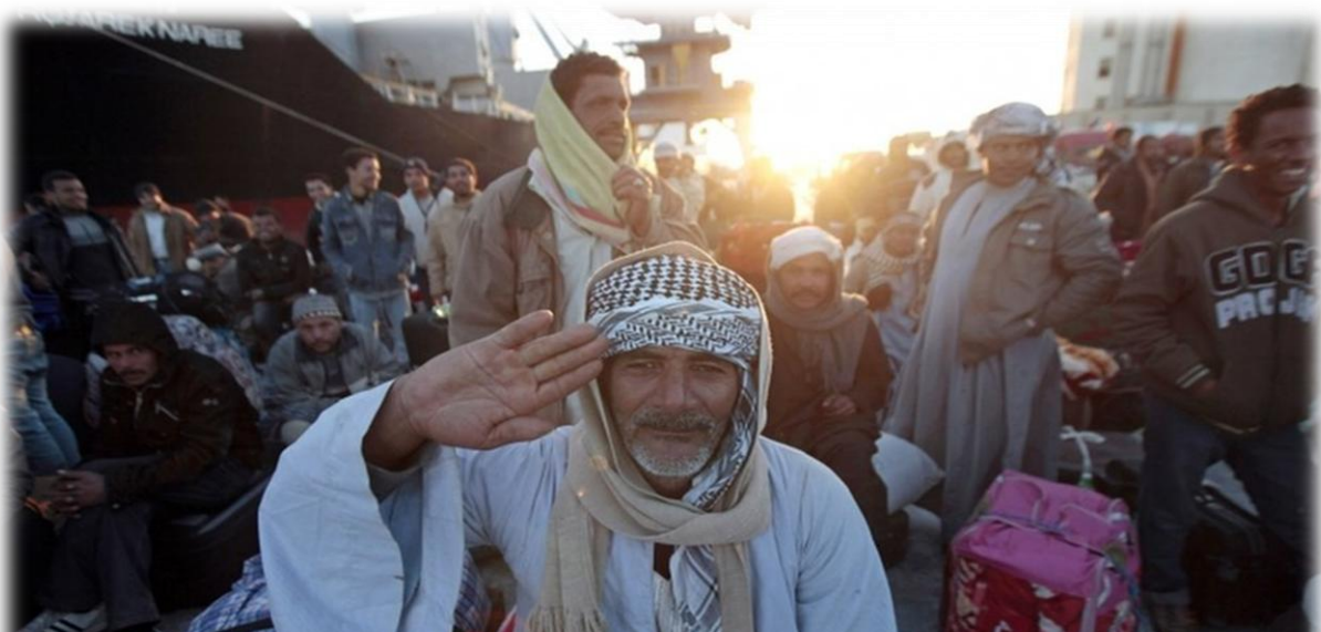
“Refugiados civiles producto del conflicto interno” (BBC.In pictures: Conflict in Libya)

En 2003 la administración de Gaddafi accede a desmantelar de forma inmediata todos sus programas de armas de destrucción masiva, replanteando nuevamente una relación diplomática con la Organización de Naciones