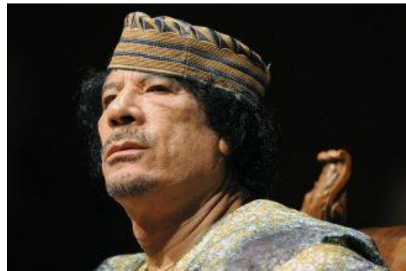
“Presidente Muammar Gaddafi”

Orden de Detención contra Muammar Mohammed Abu Minyar Gaddafi, por presunta responsabilidad penal bajo el Artículo 7 (1) de los Estatutos en la comisión de Crimen de Lesa Humanidad de (a) Asesinato y (h) Persecución de la población civil, como crímenes contra la humanidad del 15 de febrero de 2011 en adelante a lo largo del territorio de Libia en ciudades como Trípoli, Bengasi y Misrata.